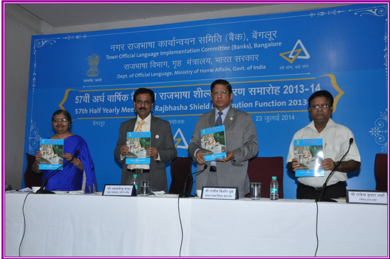
"प्रयास" पत्रिका का 29वें अंक का विमोचन