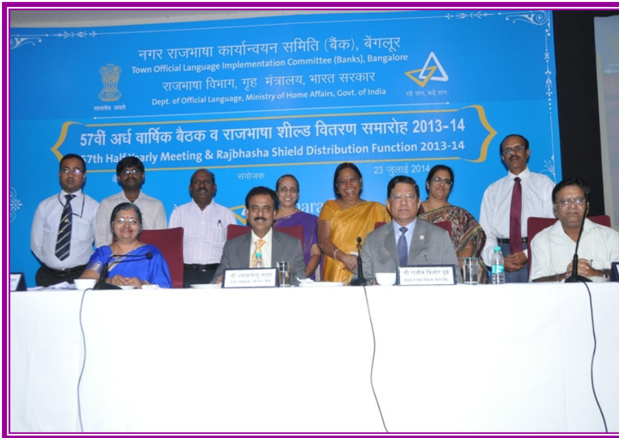
अतिथियों के साथ "प्रयास" का संपादक मंडल