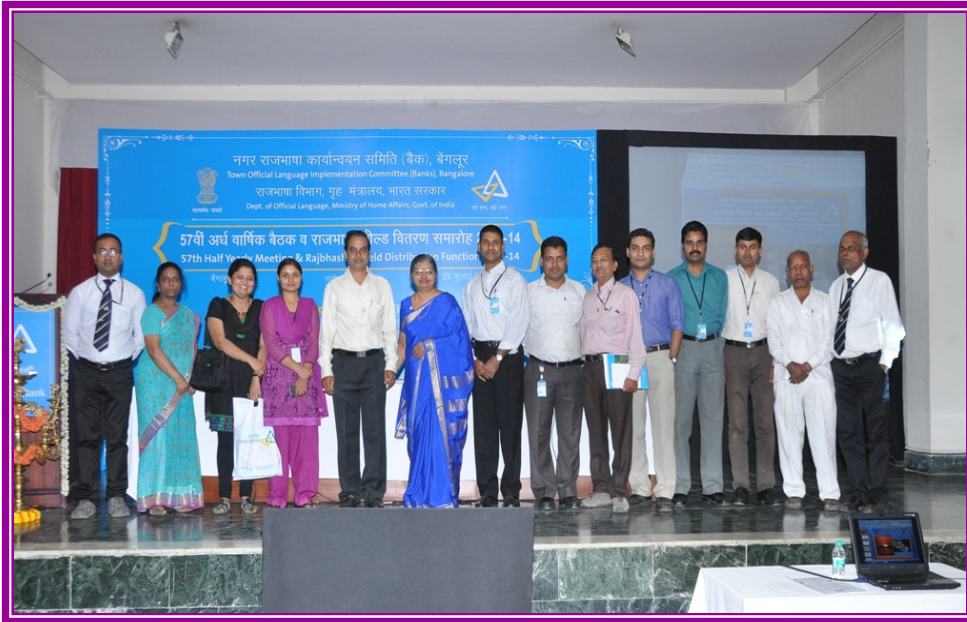
केनरा बैंक, प्रधान कार्यालय, राजभाषा अनुभाग के सदस्य